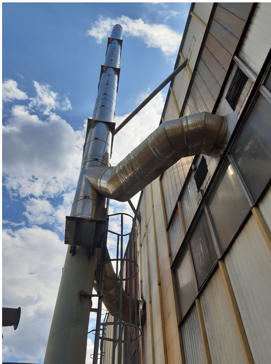
Fot.10. Widok istniejącego komina stalowego nr 2 i 3 – przeznaczonych do rozbiórki.