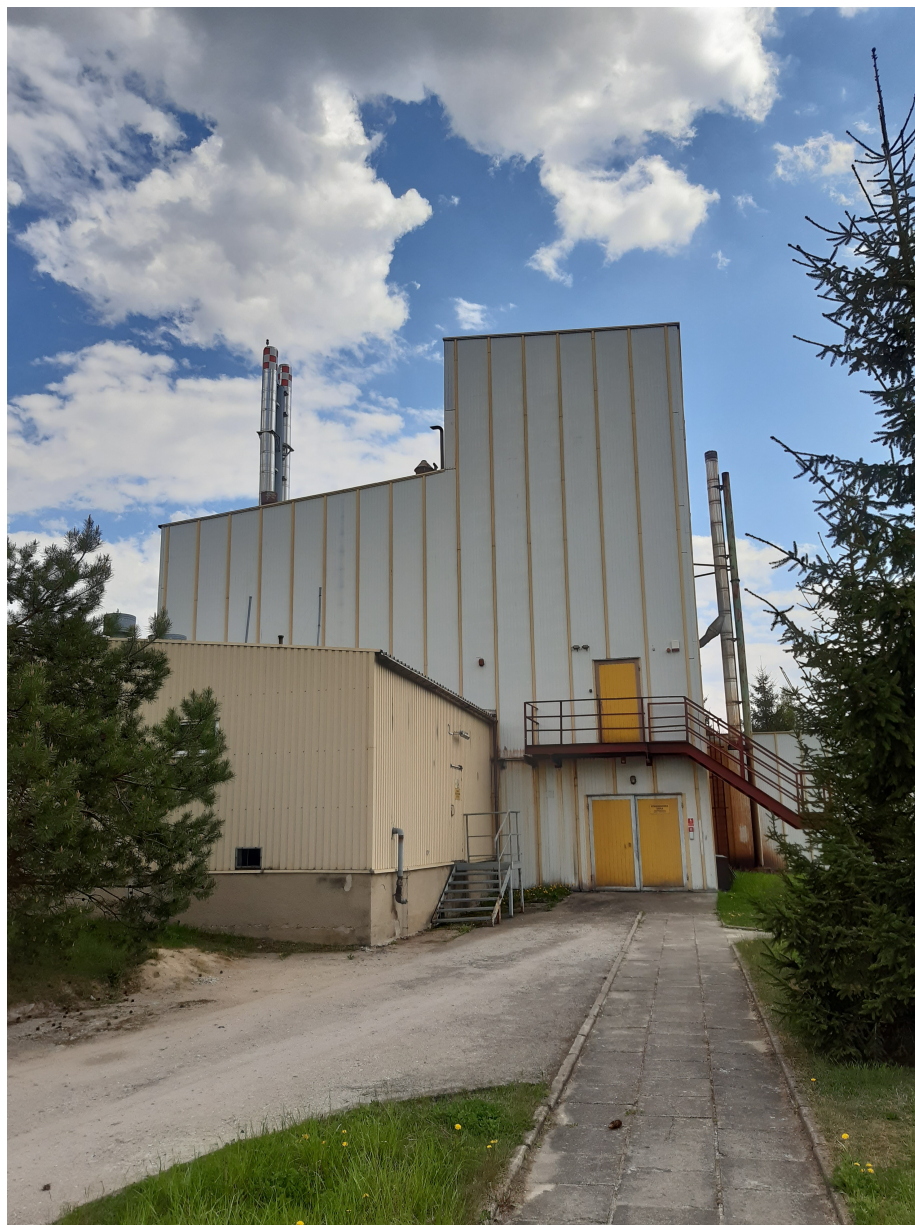
Fot.6. Widok istniejącego kominu stalowego nr 1 (po prawej stronie), oraz kominów nr 2 i 3 (po lewej stronie) – przeznaczonych do rozbiórki.