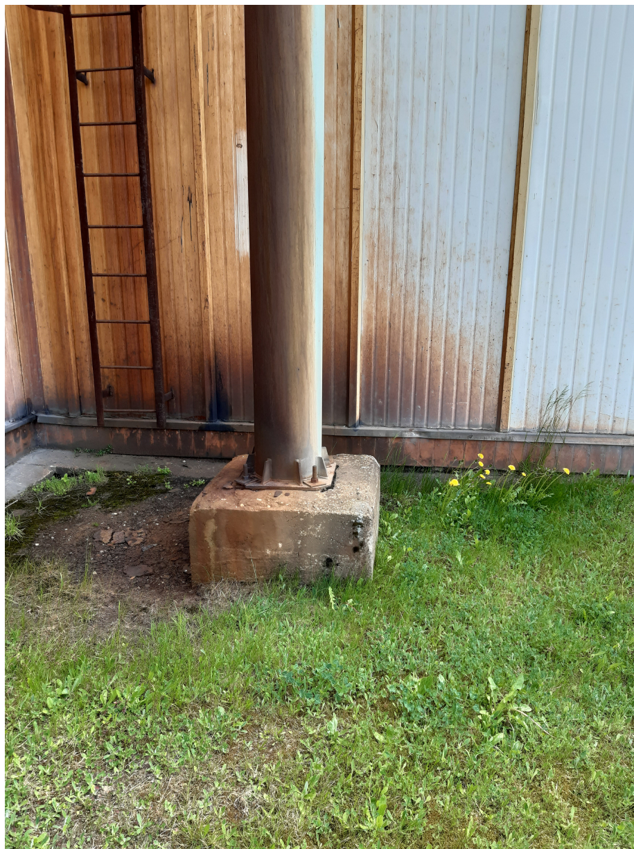
Fot.5. Widok istniejącego komina stalowego nr 1 – przeznaczonego do rozbiórki.