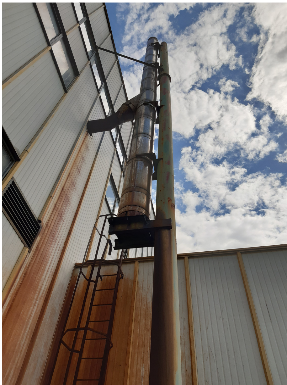
Fot.4. Widok istniejącego komina stalowego nr 1 – przeznaczonego do rozbiórki.