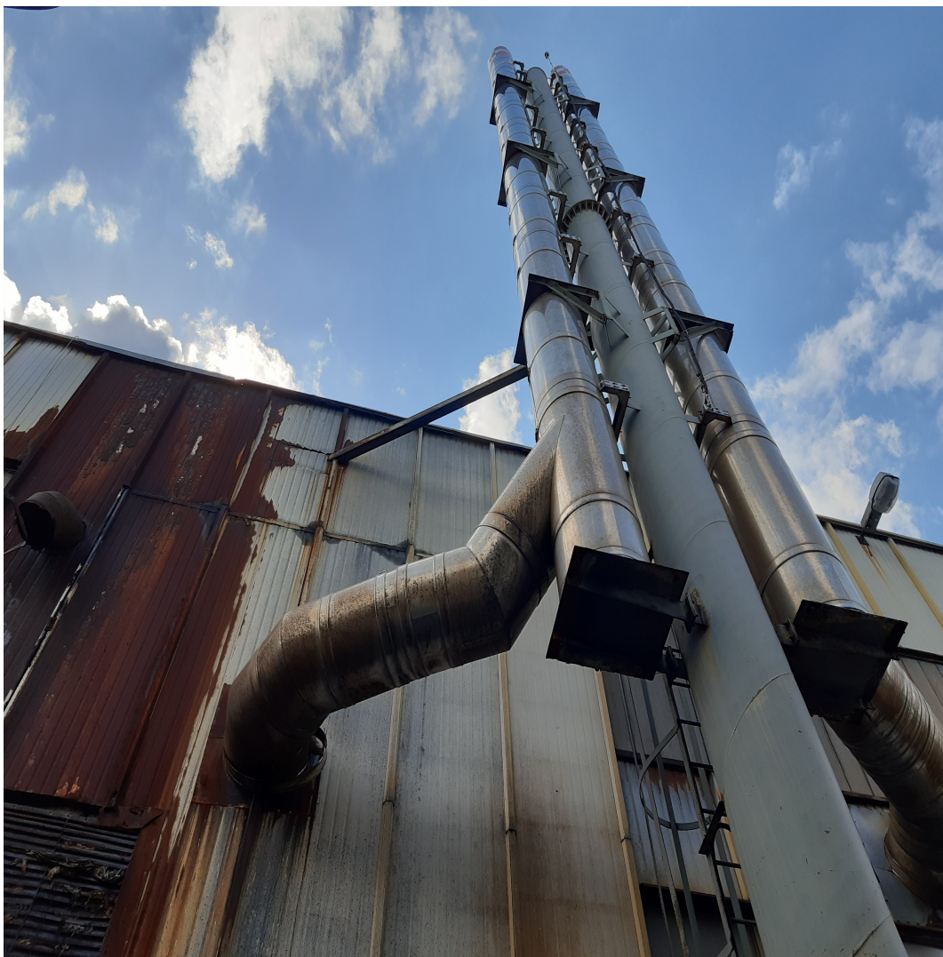
Fot.11. Widok istniejącego komina stalowego nr 2 i 3 – przeznaczonych do rozbiórki.