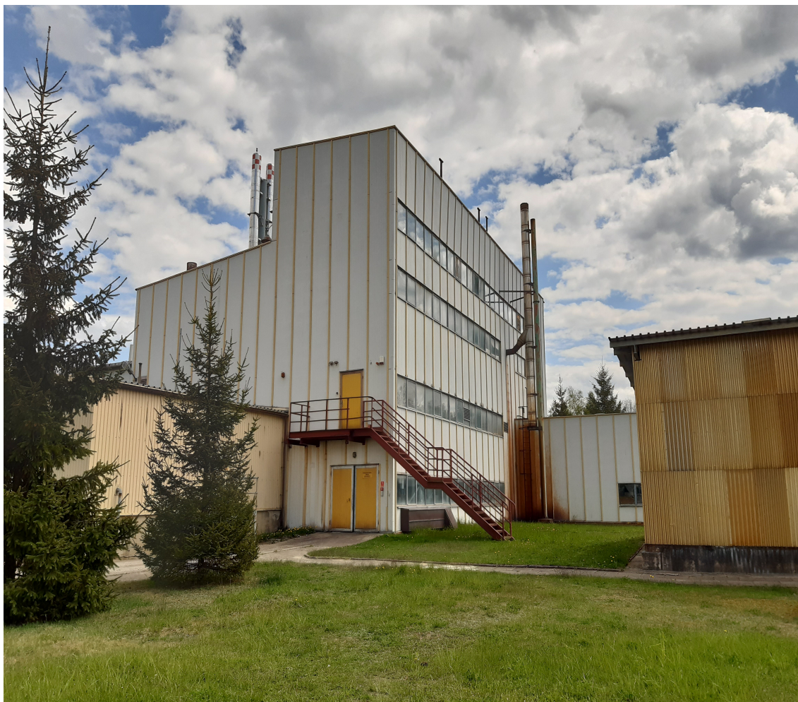
Fot.1. Widok istniejącego komina stalowego nr 1 – przeznaczonego do rozbiórki.