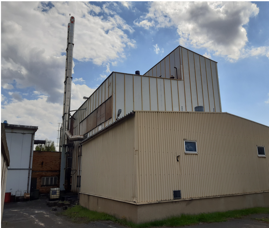
Fot.8. Widok istniejącego komina stalowego nr 2 i 3 – przeznaczonych do rozbiórki.