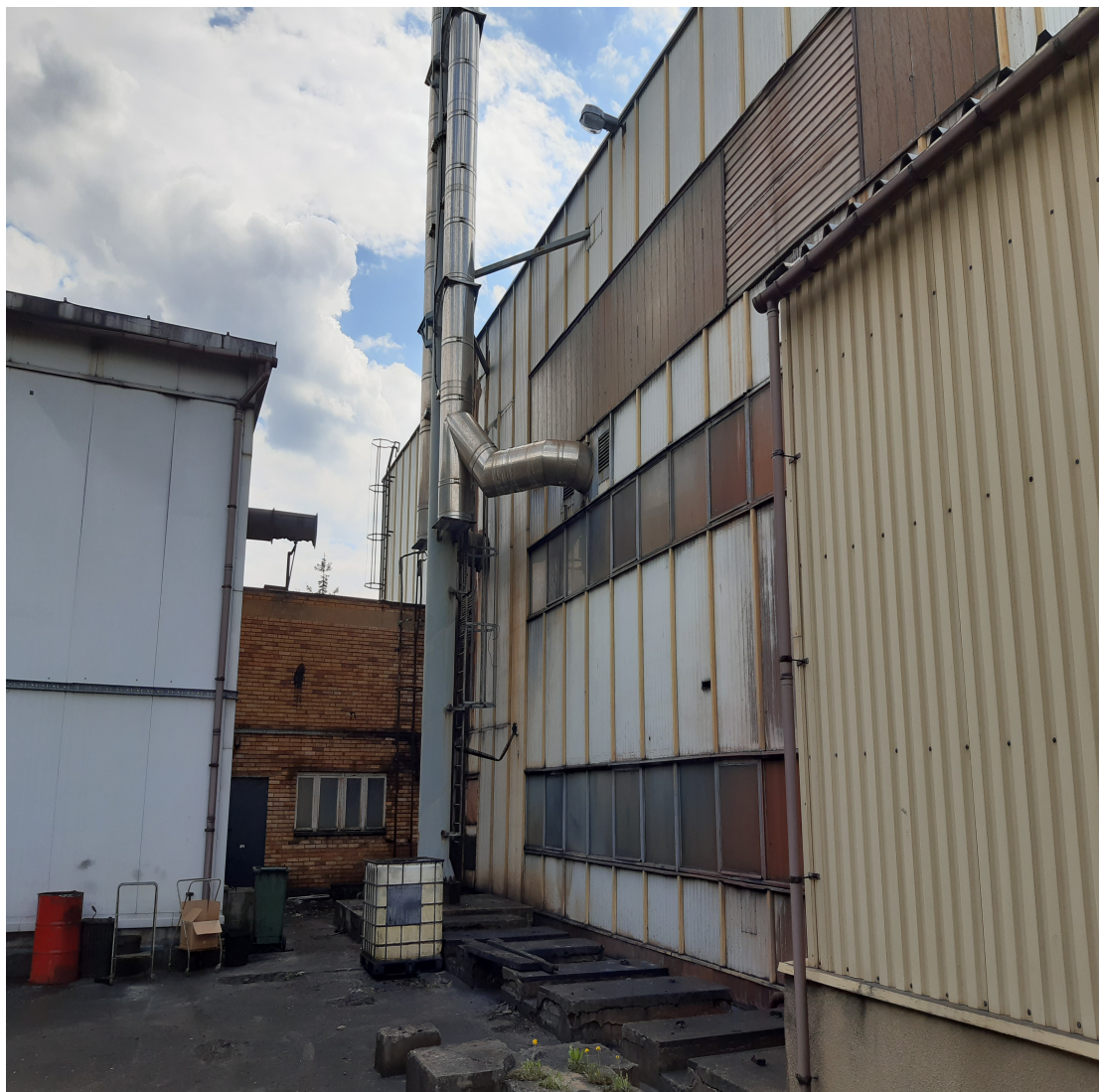
Fot.9. Widok istniejącego komina stalowego nr 2 i 3 – przeznaczonych do rozbiórki.