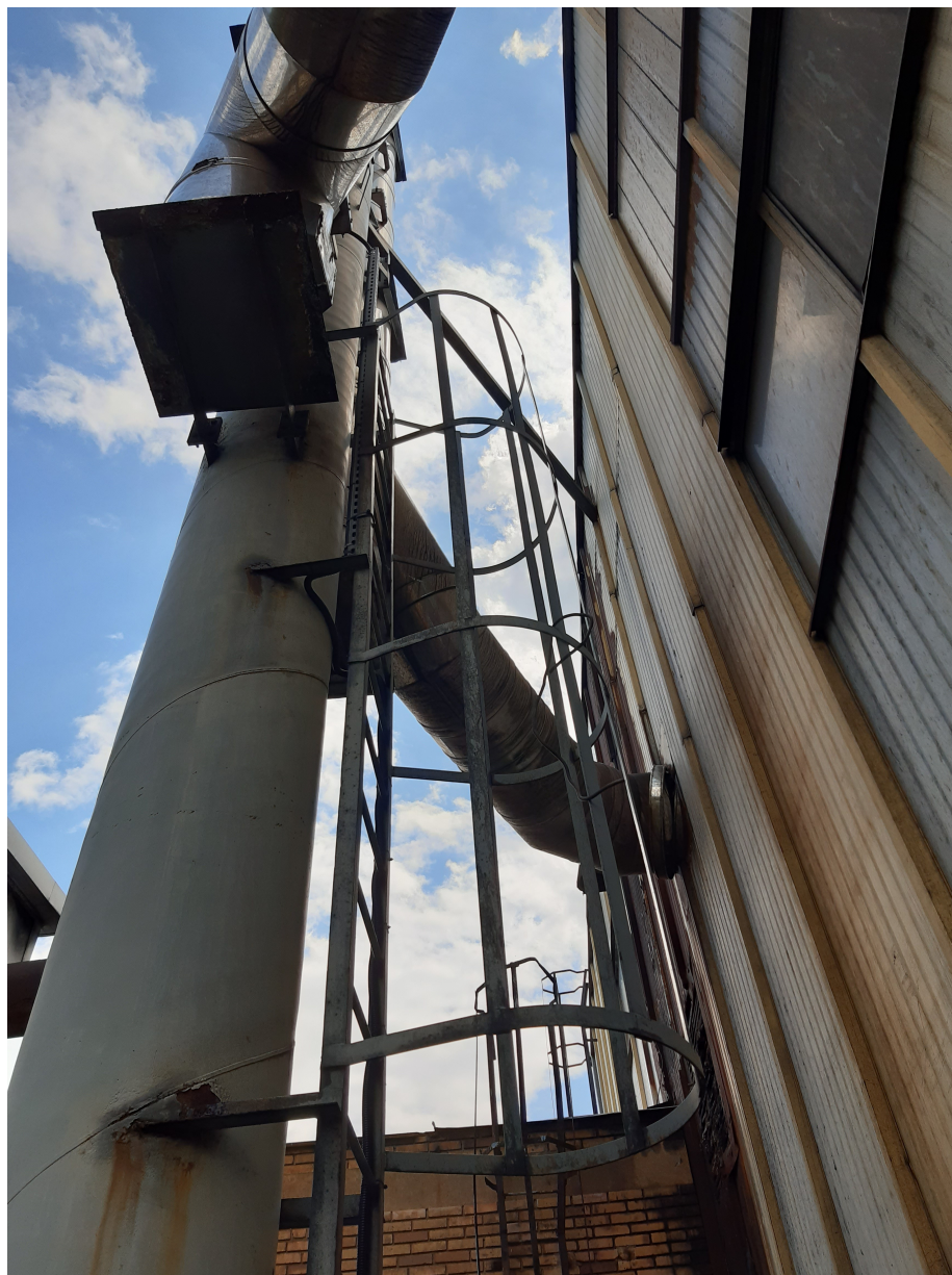
Fot.12. Widok istniejącego komina stalowego nr 2 i 3 – przeznaczonych do rozbiórki.