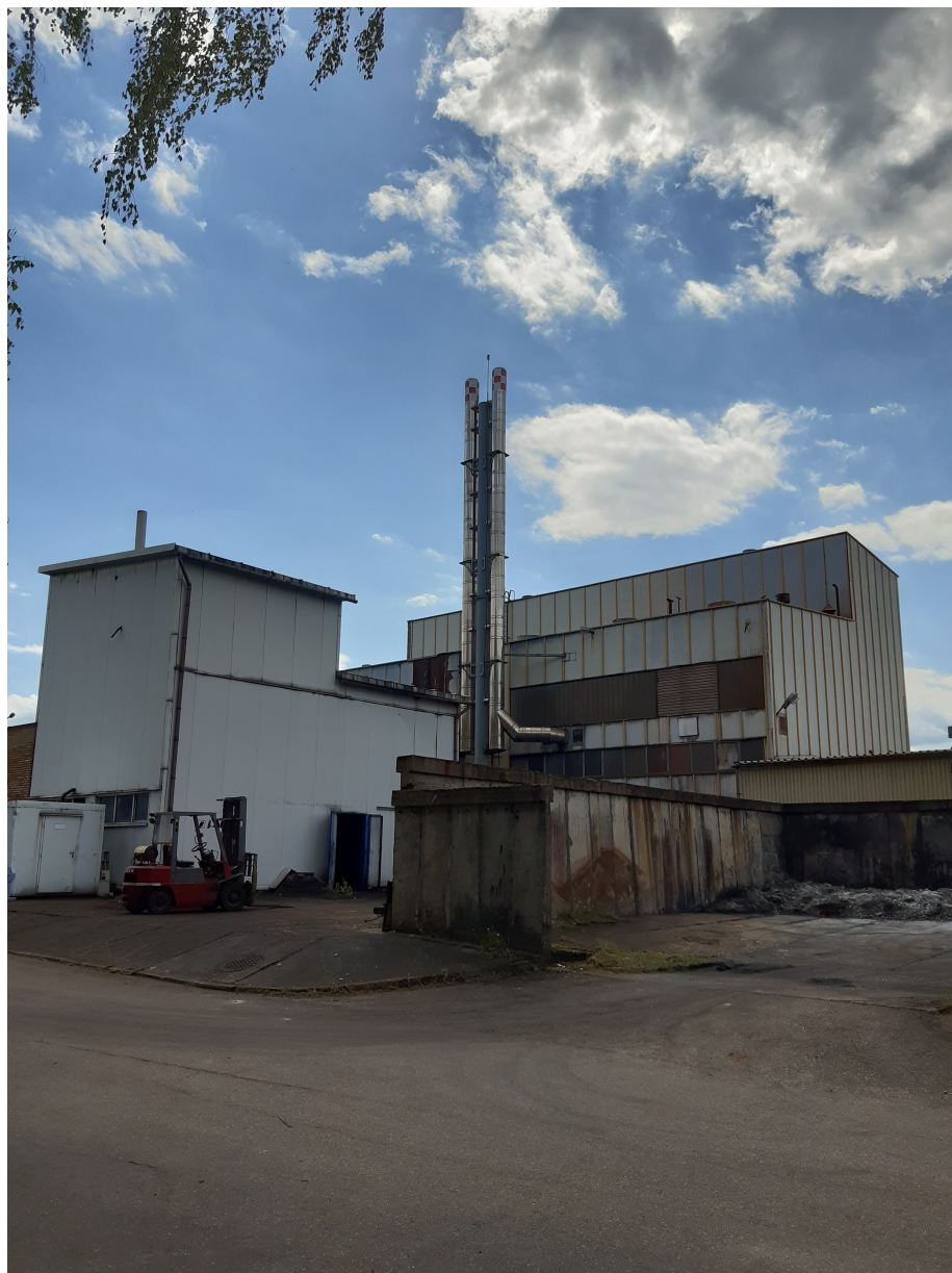
Fot.7. Widok istniejącego komina stalowego nr 2 i 3 – przeznaczonych do rozbiórki.