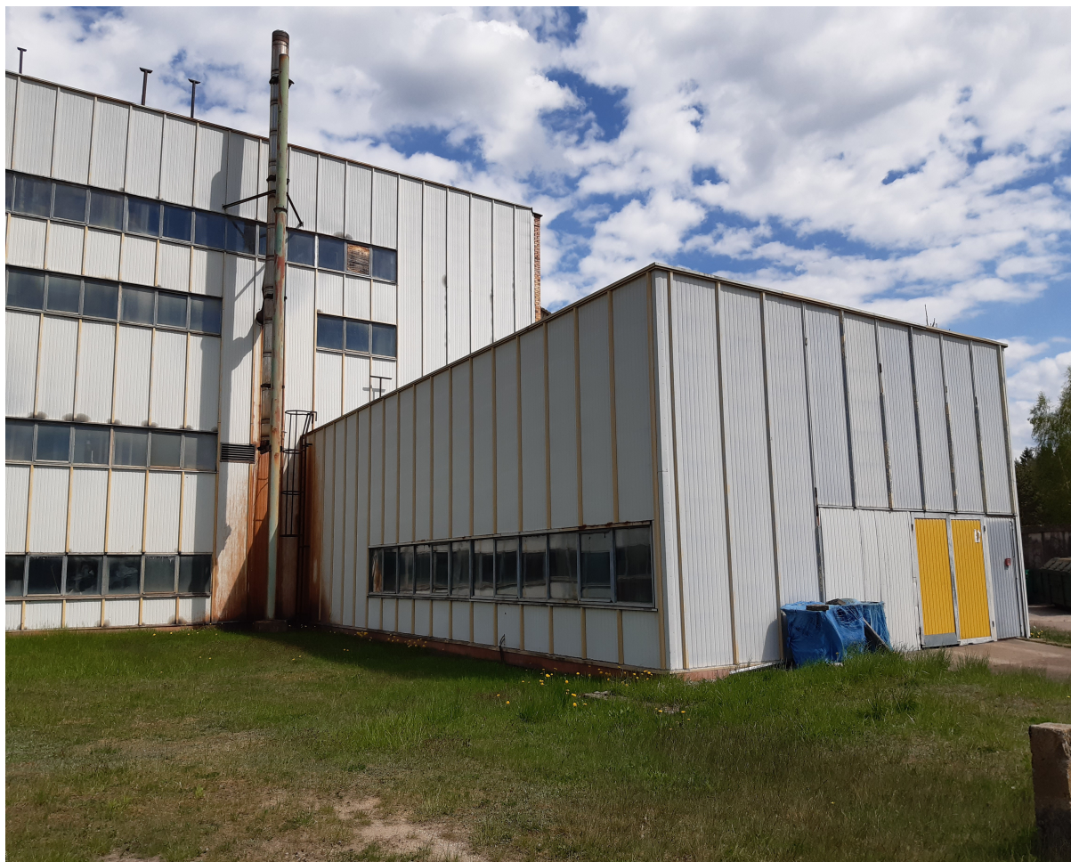
Fot.2. Widok istniejącego komina stalowego nr 1 – przeznaczonego do rozbiórki.