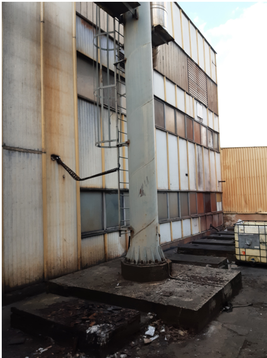
Fot.13. Widok istniejącej podstawy (na fundamencie betonowym) kominów stalowych nr 2 i 3 – przeznaczonych do rozbiórki.